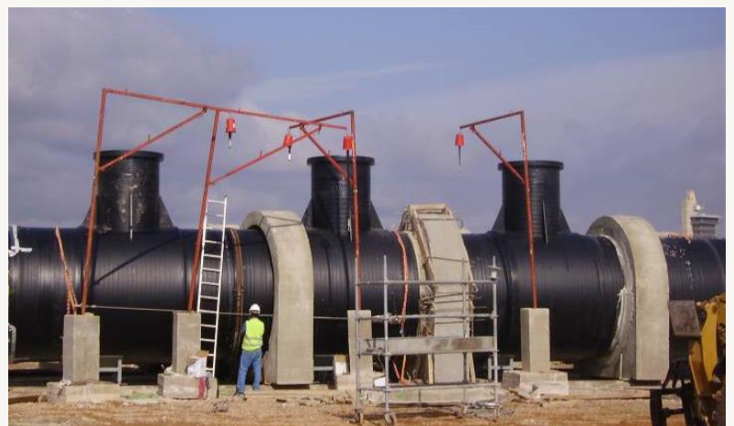
Circuito de refrigeración de la Central Térmica de Algeciras (España). Vista del tramo difusor Di= 2.400 mm