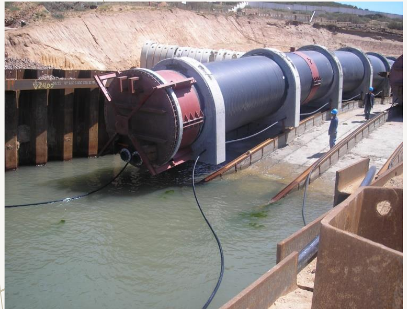
Rampa de lanzamiento de la planta desaladora de Beni-Saf (Argelia) Di= 2.400 mm

Servicios ofrecidos a los clientes en todas las fases del proceso de creación y construcción de una obra portuaria.