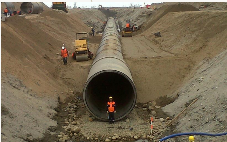
Emisario Submarino de La Taboada (Lima, Perú). Di= 3.000 mm

Servicios ofrecidos a los clientes en todas las fases del proceso de creación y construcción de una obra portuaria.