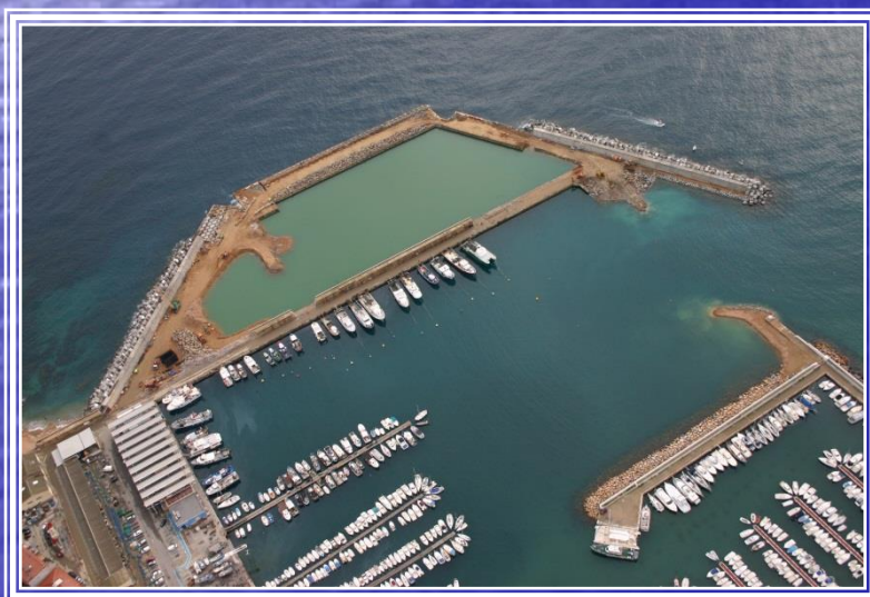
Ampliación Puerto de Blanes