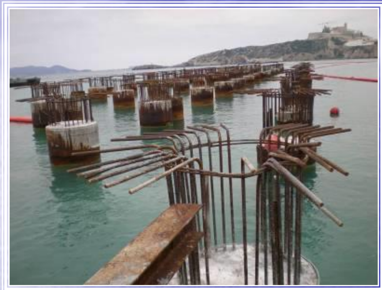
Ampliación Puerto de Ibiza

Ingeniería Creativa Pita SL , INCREA, es una empresa española de ingeniería dedicada a proyectos y consultoría de ingeniería civil