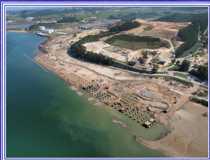
Ampliación Puerto Avilés Margen Derecha

Nos caracterizamos por ofrecer servicios a los clientes en todas las fases del proceso de creación y construcción de una obra portuaria