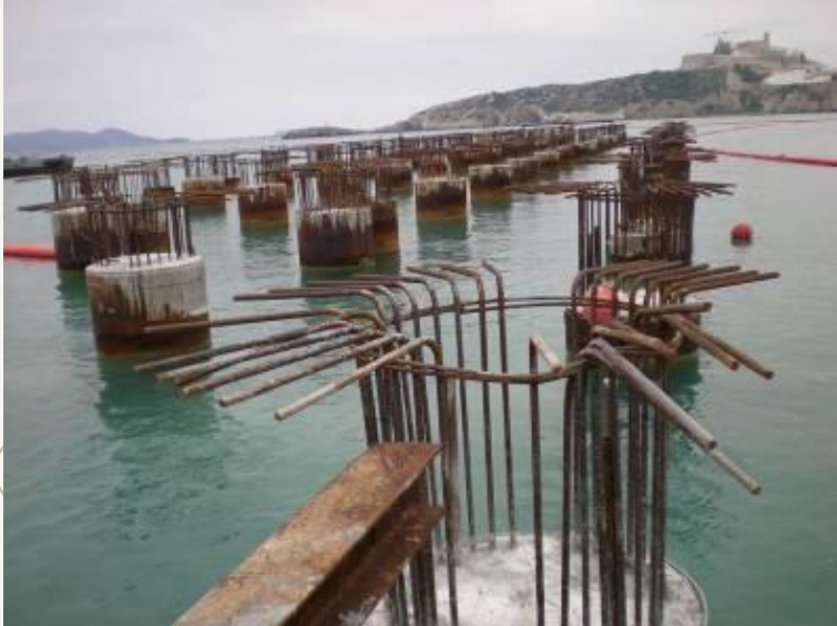
Ampliación Puerto de Ibiza

Ingeniería Creativa Pita SL, empresa española de ingeniería dedicada a proyectos y consultoría de ingeniería civil.