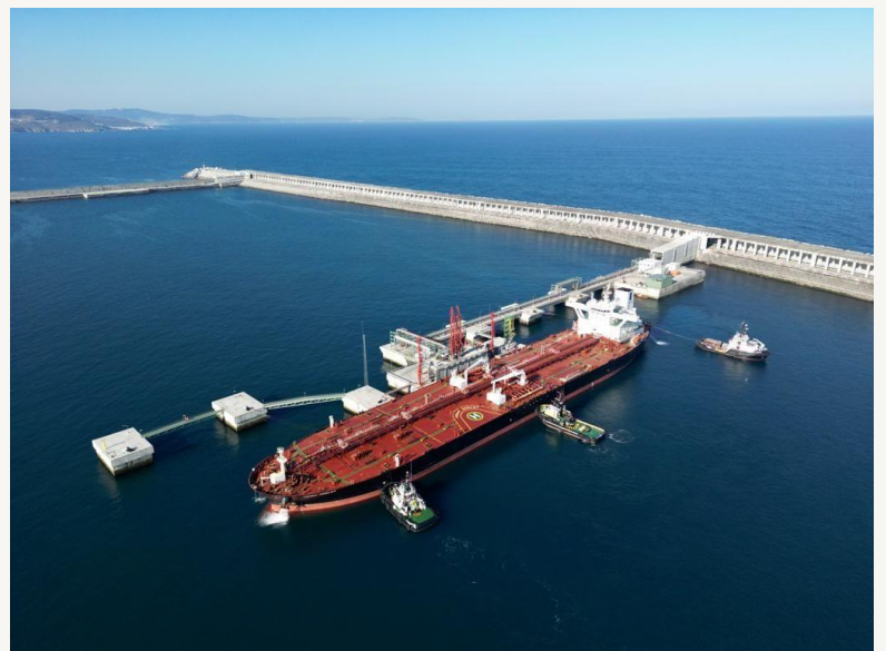
Pantalán de descarga de crudo en el Puerto Exterior de Langosteira (La Coruña)

Servicios ofrecidos a los clientes en todas las fases del proceso de creación y construcción de una obra portuaria.